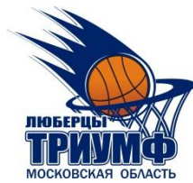
Дворец Спорта "Триумф" Московская область, г. Люберцы, улица Смирновская, дом 4