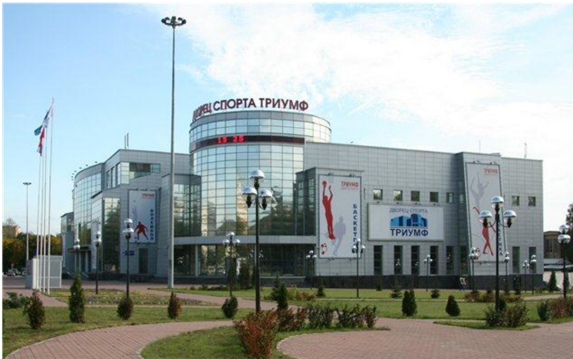
Вид спортивной арены Дворца Спорта "Триумф"